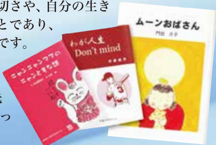
絵本風にも、エッセイ風にも。 あなたのイメージに合った自分史づくりを お手伝いします。